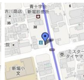
⑩ローソン新堀1丁目店