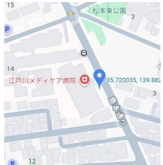
⑫江戸川メディケア病院