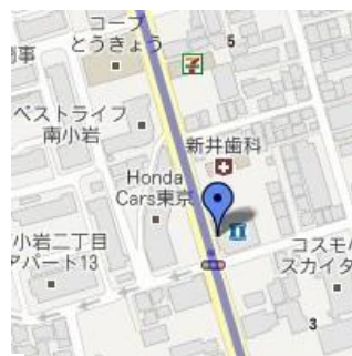
④ローソン東小岩1丁目店