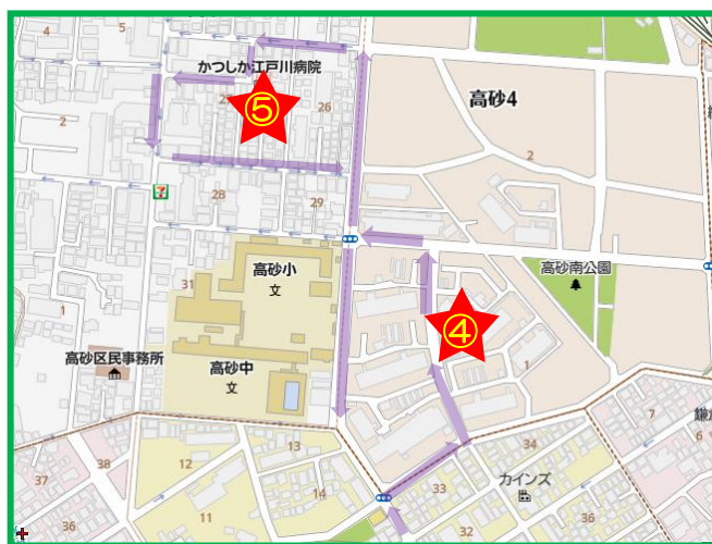
④⑧高砂団地集会所 ⑤⑦かつしか江戸川病院