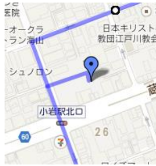
⑤整形メディカルプラザ