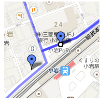
⑥小岩駅北口ローター

※道路の駅側に停車します。(降車のみ) 乗車は④小岩駅北口クリニックでお願いします。