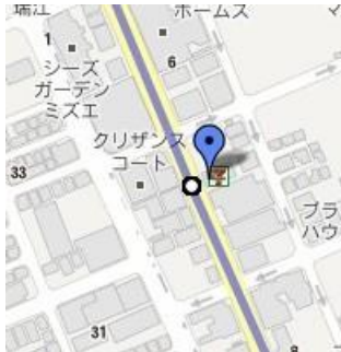
⑦セブンイレブン南篠崎4丁目店