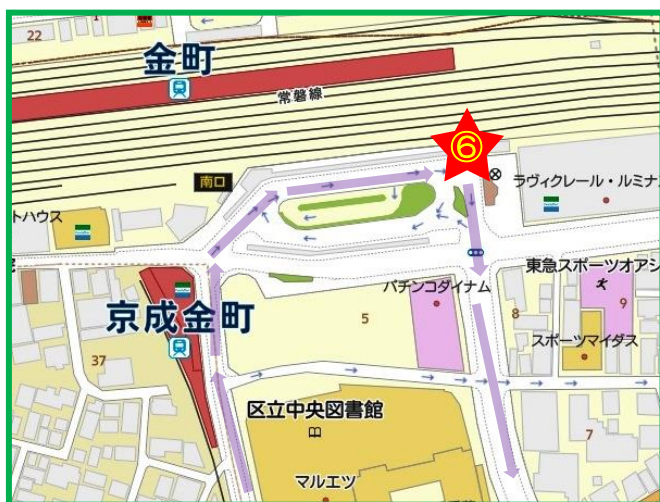
⑥JR金町駅南口 ロータリー