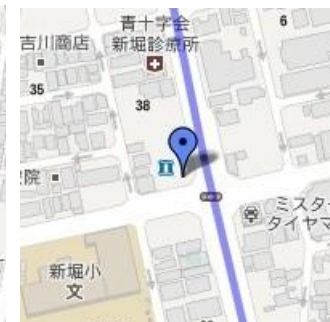
⑩ローソン新堀1丁目店