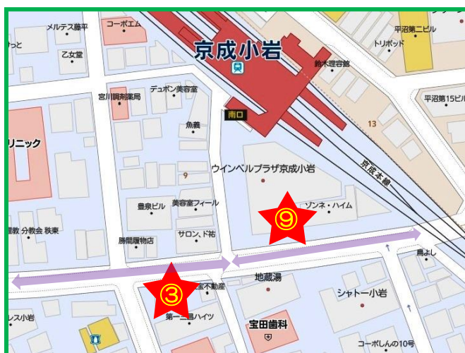
京成小岩駅南口 ③ホーム11前(金町駅方向) ⑨おひさま整骨院前(江戸川病院方向)