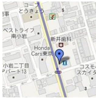
④ローソン東小岩1丁目店