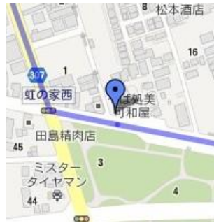
⑤西篠崎さくら公園