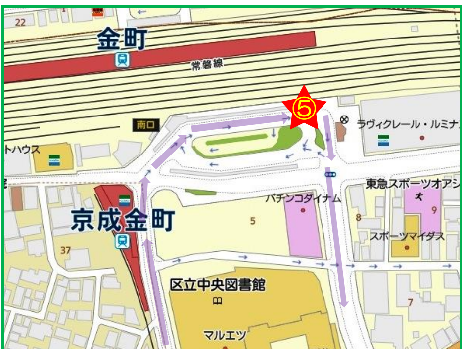
⑤JR金町駅南口 ロータリー

※ダイヤは目安です。遅れが発生する場合がございますのでご了承ください。また事故、車両故障等で運行できないこともありますので、バスが来ない際は、病院にお問い合わせ下さい。