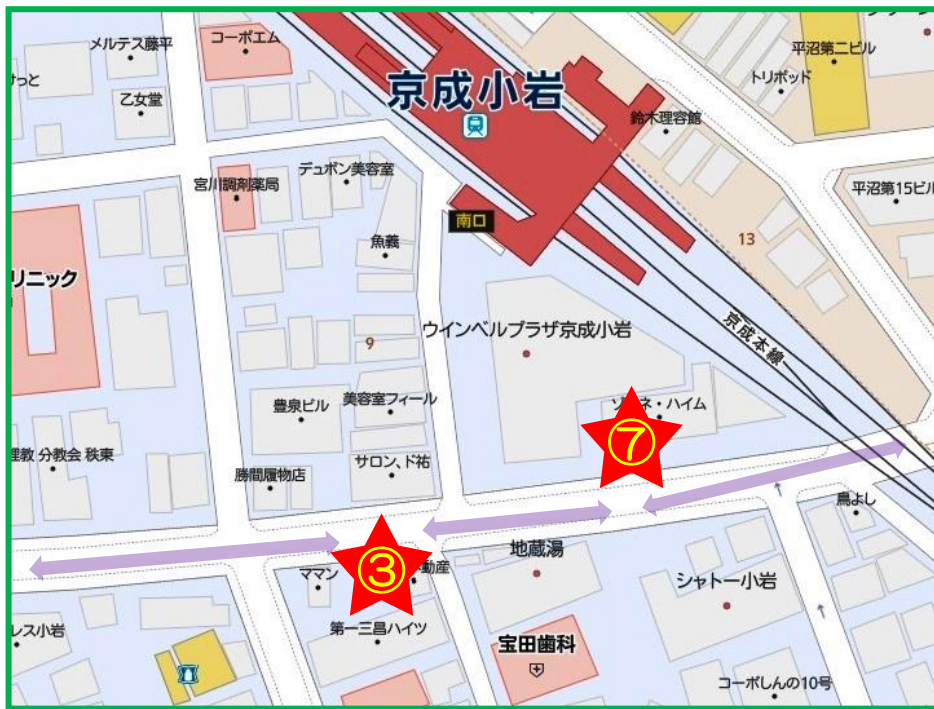
京成小岩駅南口 ③ホーム11前(金町駅方向) ⑦おひさま整骨院前(江戸川病院方向)