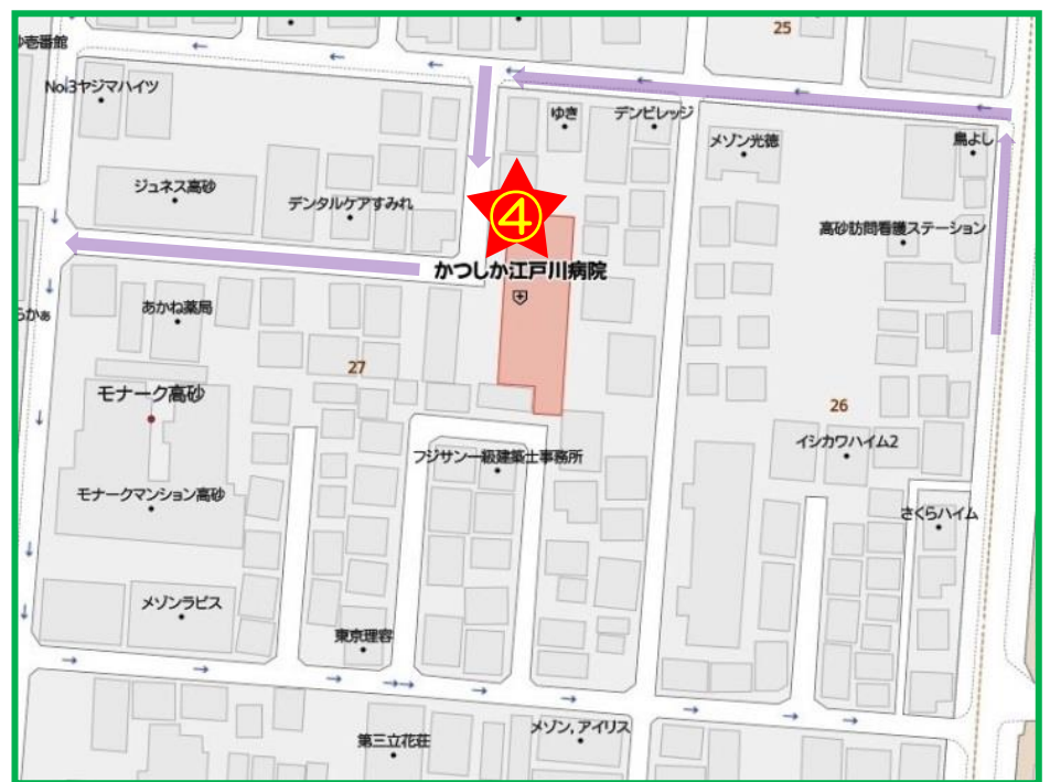
④⑥かつしか江戸川病院