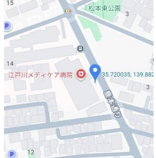
⑫江戸川メディケア病院