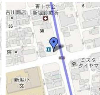
⑩ローソン新堀1丁目店